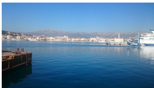
Luka Split na Jadranskom moru

Na osnovu historijskog nasljeđa i njegove 1700 godina duge tradicije, grad i luka Split su postali neizbježna destinacija brodova koji plove Mediteranom. 2014 godine blizu 4.5. miliona putnika je putovalo preko gradske luke ali također i 600.000 vozila i 3 miliona tona tereta.